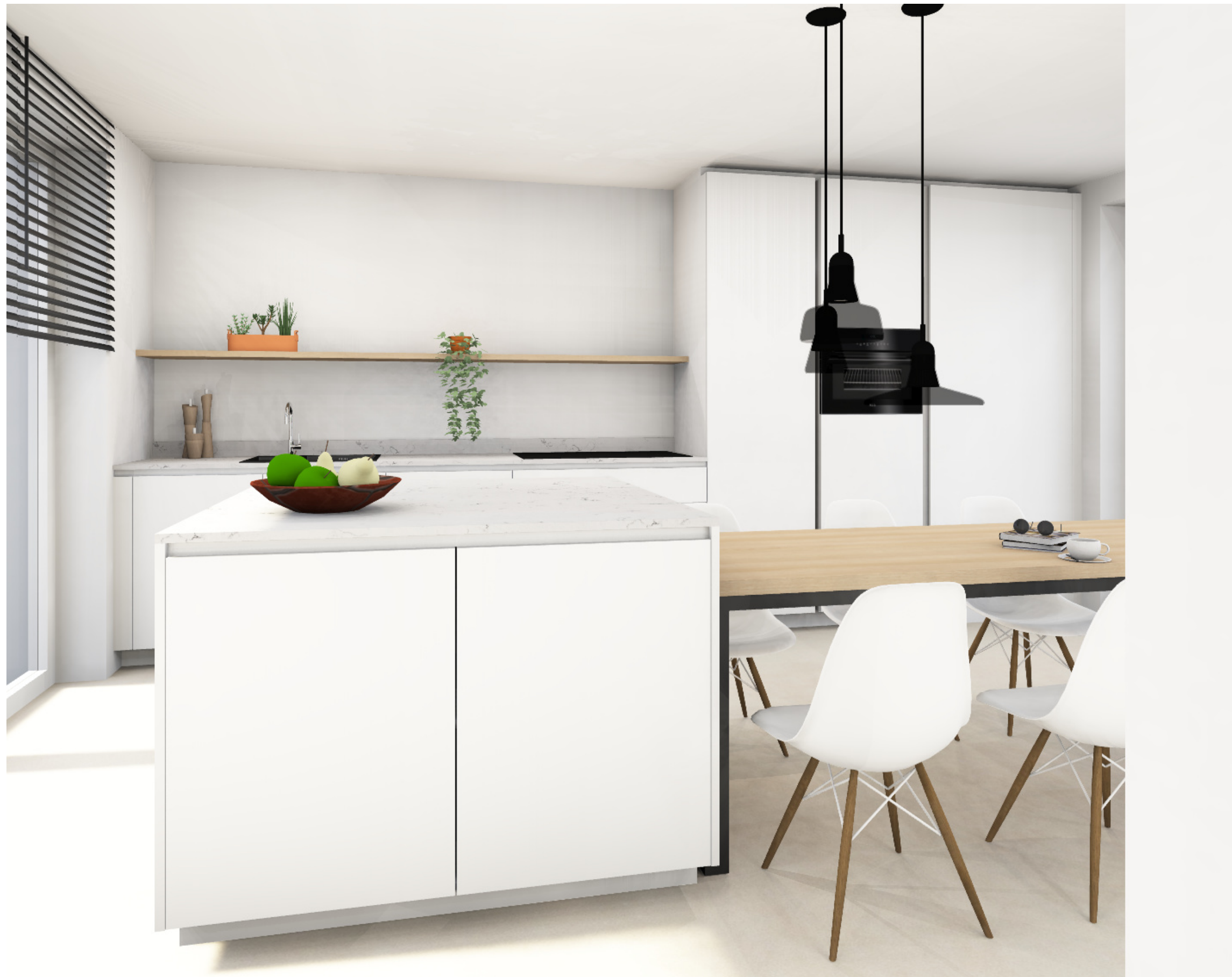
voorstel met oven in midden